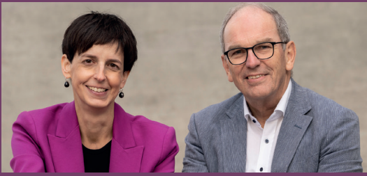
DAMANN + HARTMANN